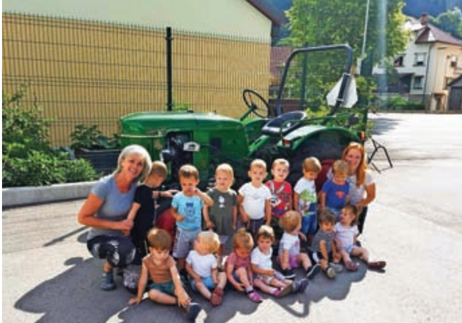
Plesalčki so spoznavali vozila.

Posebno poučno dopoldne pa so v poletnih dneh imeli otroci v skupini Plesalč-