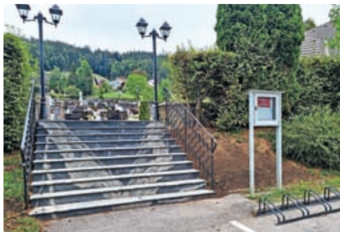
Pred glavnim vhodom so namestili novo kovano ograjo.

»Dostop na pokopališče vodi neposredno mimo smetnjakov, zato je predvideno, da se na tem delu uredi kamniti zid, ki bi delno zakril smetnjake.« Poleg tega so pred kamnitim zidom predvideli umestitev pitnika in klopi. Dela bodo sicer do nadaljnjega še počakala. Na glavnem vhodu na pokopališču so že pred časom odstranili živo mejo, v juniju pa namestili