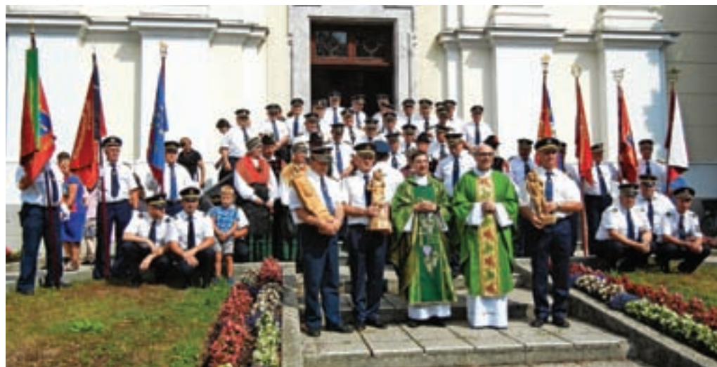
Krištofova nedelja v Žireh