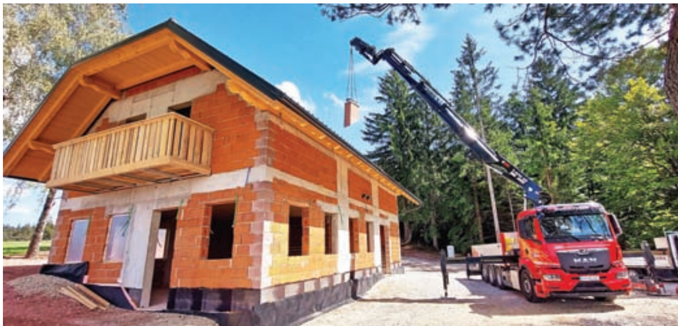
Gradnja Doma nad Zalo je tekla po načrtu.