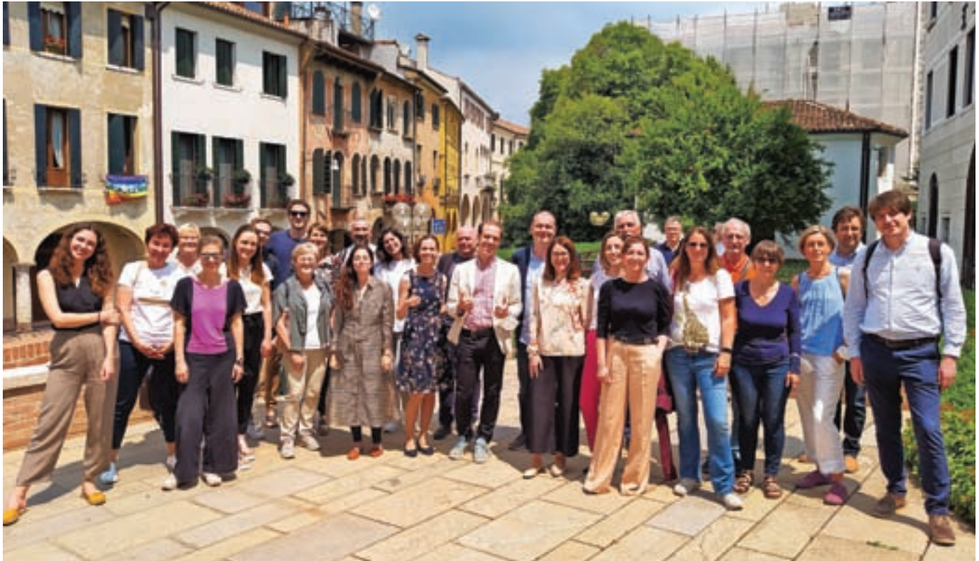
Predstavniki vseh pilotov na zaključnem dogodku v Trevisu

V mednarodnem projektu TAAFE (Naproti starosti prijaznim skupnostim na območju Alp), ki se je zaključil konec julija, so poleg Slovenije in Občine Žiri sodelovale še Avstrija, Francija, Nemčija in Italija. Tokrat v prispevku nekaj več o izvajanju projekta v različnih državah.