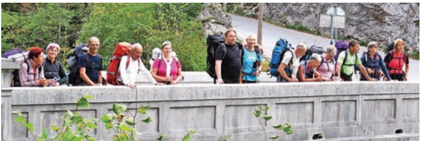
Z romanja v Kranjsko Goro