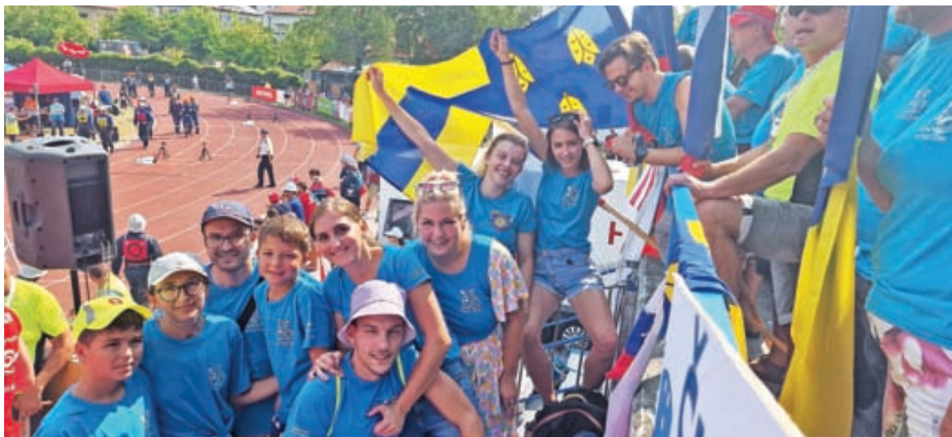
Podpora s tribune

ja, dan uradne olimpijske tekme. »Priprave na tekmo je začela vsaka pri sebi, nato pa smo na progi 9 od začetka do konca tekme dihale skupaj, vse za eno in ena za vse. Za dodaten adrenalin pa so poskrbeli še naši navijači, ki smo jih zaslišale že od daleč, takoj ob prihodu