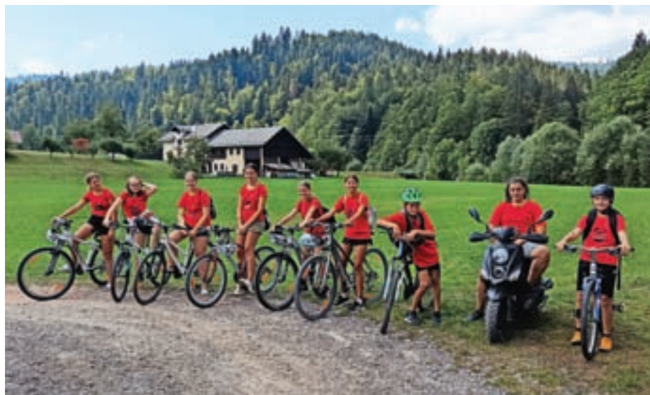
Tudi letos so v Žireh pripravili aktivne počitnice za otroke.

Počitniške aktivnosti so obsegale igranje ameriškega nogometa in namiznega tenisa, judo, lokostrelstvo, plezanje, odbojko na mivki, jahanje konj, spoznavanje fitnes naprav in vadb, ustvarjalne delavnice, peko makovk in sirovih štručk, ples ob drogu, pohod v naravi, ulične in vodne igre, kopanje, obisk knjižnice ter ure pravljic. Pomoč pri organizaciji so nudili Poclairn Hydraulics,