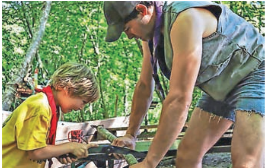
Na taboru se otroci urijo v različnih veščinah.