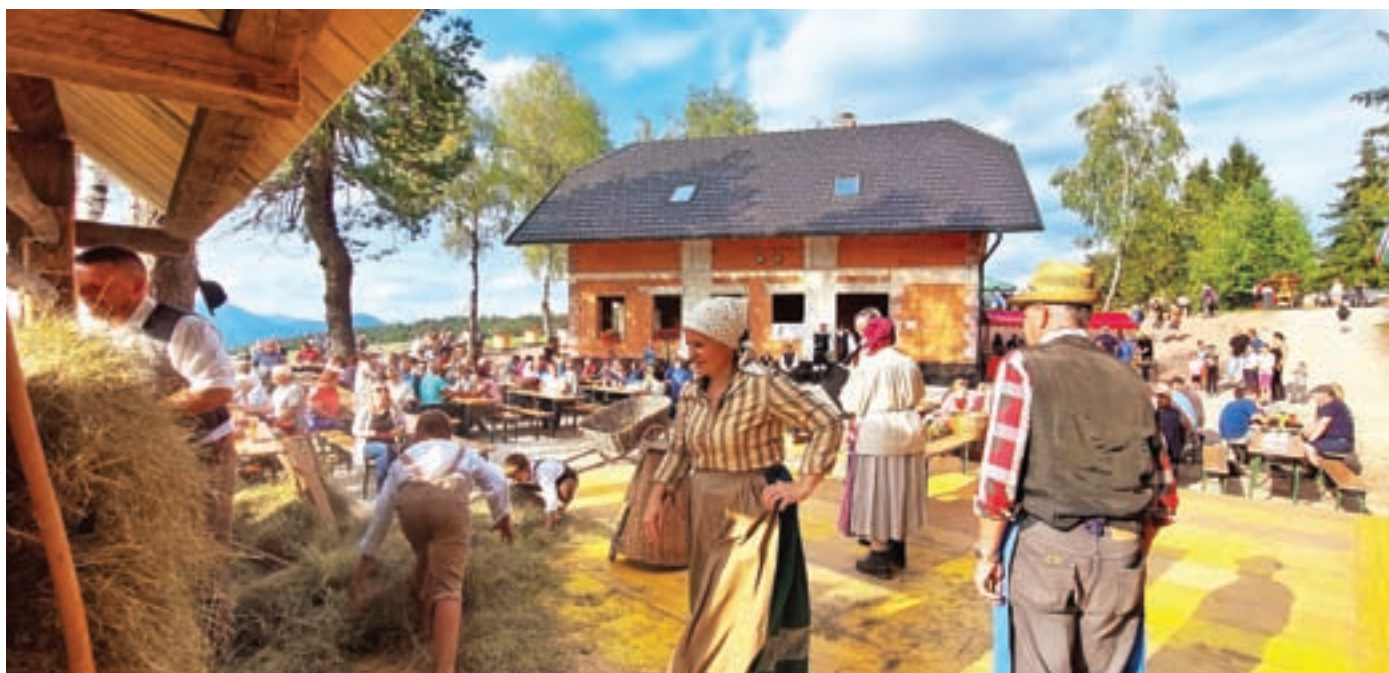
S Pokošnjico so obujali navade in običaje ob spravilu sena.

Na pridobljeni parceli je ob prevzemu sicer že stal objekt s statusom eviden-tirane črne gradnje, a so se zaradi do-trajanosti odločili za rušenje in gradnjo nove, sodobne stavbe, ki bo v največji meri omogočala razvoj društva. Delati so začeli lani in najprej zgradili novo cesto, uredili dvorišče in okolico ter