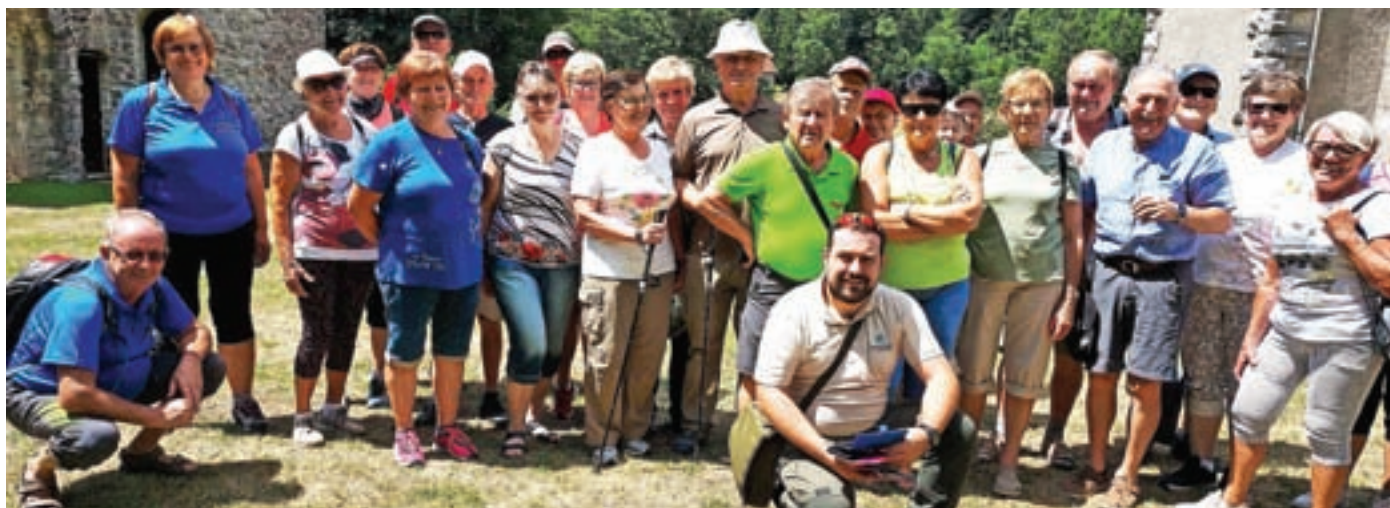
Del udeležencev izleta na Mašunu