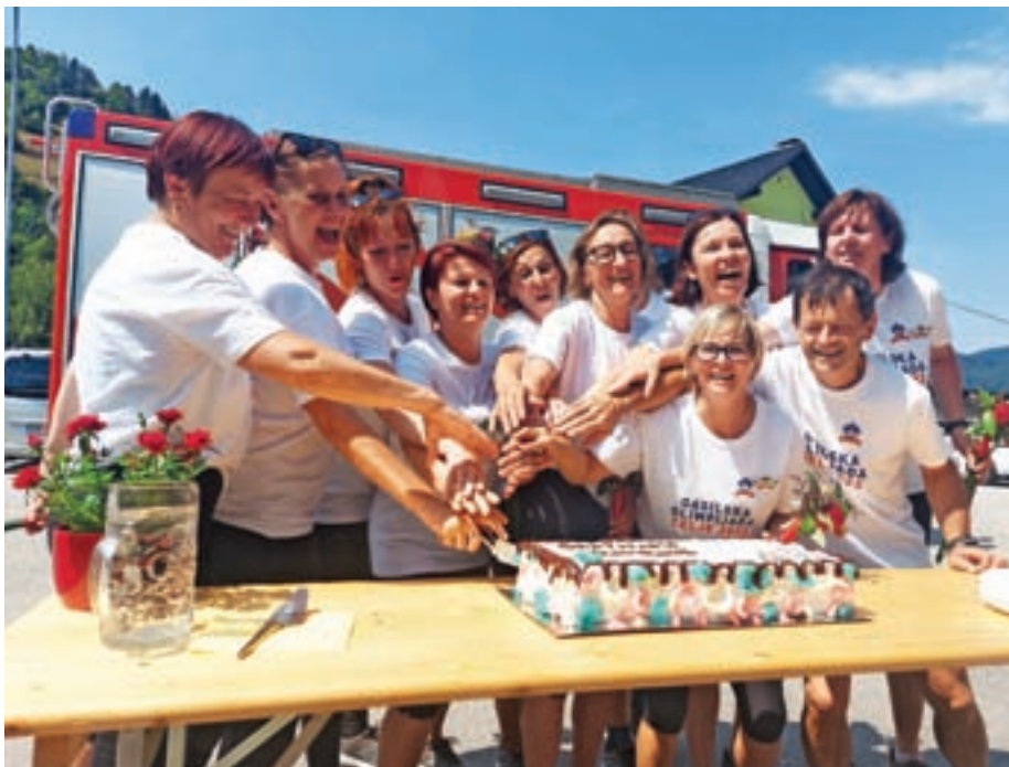
Gasilske olimpijke je v domačih Žireh pričakal slovesen sprejem.