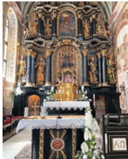
Prte za cerkev v Olimju so s čipkami okrasile žirovske klekljarice.