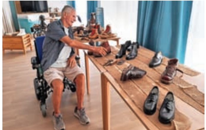
Pripravili smo Čevljarški dan.

Z željo živeti čimbolj ustvarjalno se zaposleni zato trudimo, da z najrazličnejšimi aktivnostmi stanovalcem zapolnimo njihov prosti čas. Z organiziranjem različnih dejavnosti jim omogočamo, da podoživljajo mlade dni, se spominjajo trenutkov, ko so skupaj s prijatelji in sorodniki, otroki ali vnuki ustvarjali, se igrali, kuhali, peli in tudi plesali. Med drugim smo se lotili priprave zelišč za čaje, ki nas bodo lahko pogreli ob hladnejših dneh. Ker si želimo, da bi postali medgenera-