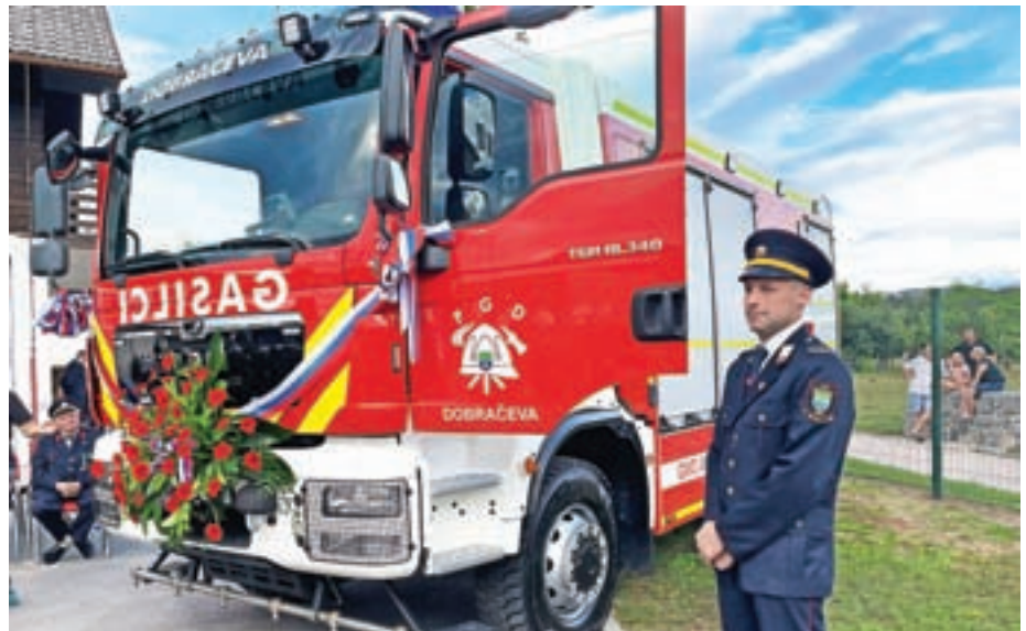
V PGD Dobračeva so slovesno prevzeli novo gasilsko avtocisterno.

V Prostovoljnem gasilskem društvu (PGD) Dobračeva so z gasilsko parado zaznamovali stodvajsetletnico delovanja, ob tej priložnosti pa tudi slovesno prevzeli novo gasilsko vozilo.