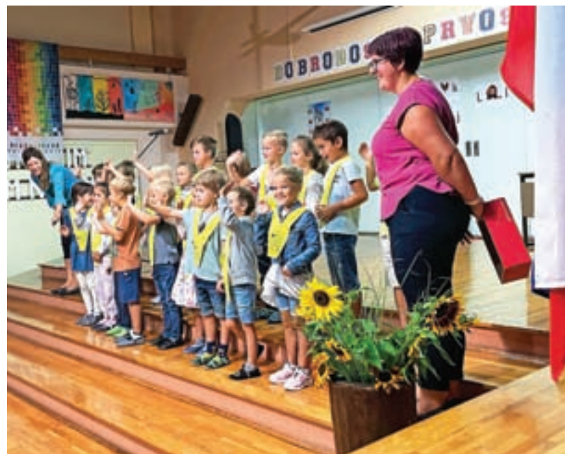
Prvošolci na Osnovni šoli Žiri

V preteklem tednu so po besedah ravnatelja potekali tudi roditeljski sestanki, na katerih so starše opozorili tudi na to, naj v šolo hodijo le zdravi otroci, da bi se izognili okužbam s covidom-19. »Sicer pa računam, da bomo pouk tako kot smo ga začeli tudi končali v šolskih klopih. S kovidom se bomo pač morali naučiti živeti,« je še dejal ravnatelj.