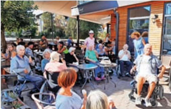
Posladkali smo se z odličnim sladoledom.

Vsaka oseba, pa naj bo mlajša ali starejša, si želi dan preživeti čim bolj prijetno, vključena v družbo, s prijatelji ali znanci.