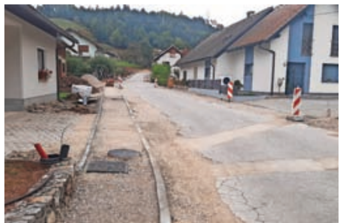
Gradnja pločnikov v Novi vasi

Gradnja pločnikov v dolžini 450 metrov poteka na dveh odsekih, in sicer od križišča Primc do odcepa Micnk po levi strani ceste in na odseku od odcepa Micnk do objekta Govekar po desni strani. Sočasno bodo obnovili tudi javno razsvetljavo in odvodnjavanje. Pogodbena vrednost del znaša 629 tisoč evrov, dela pa naj bi zaključili predvidoma do konca leta. Z naložbo bodo prispevali k večji prometni varnosti ter izboljšanju cestne infrastrukture in s tem voznih pogojev. Ta čas potekajo dela tudi na Dražgoški ulici od križišča s Partizansko cesto do stanovanjskega objekta Trček v dolžini