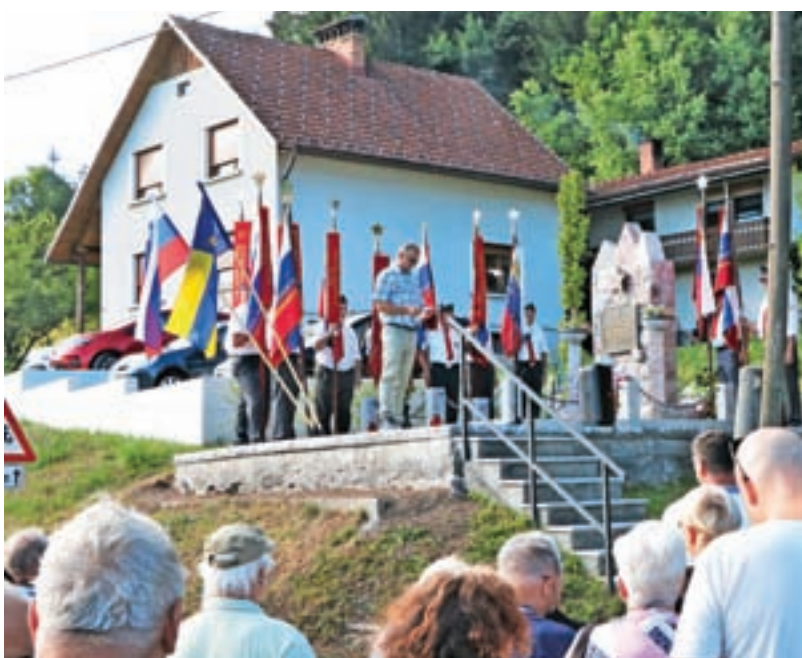
Ob končanju del so v spomin na zgodovinske dogodke pri obnovljenem spomeniku nedavno organizirali tudi krajšo kulturno prireditev.

Spoštovane bralke, spoštovani bralci Žirovskih novic, vsi se zavedamo, da je čas, ki je pred nami, zelo negotov in nič kaj spodbuden. Cene dobrin in storitev rastejo v višave, vsepovsod manjka delavcev, orožje nedaleč od nas ne potihne ... Kljub vsemu vam želim, da ostanete pogumni, močni, ohranite optimizem in vero v boljši jutri. Bodimo solidarni z drugimi, pomagajmo si med seboj in pozabimo na sebičnost in egoizem.