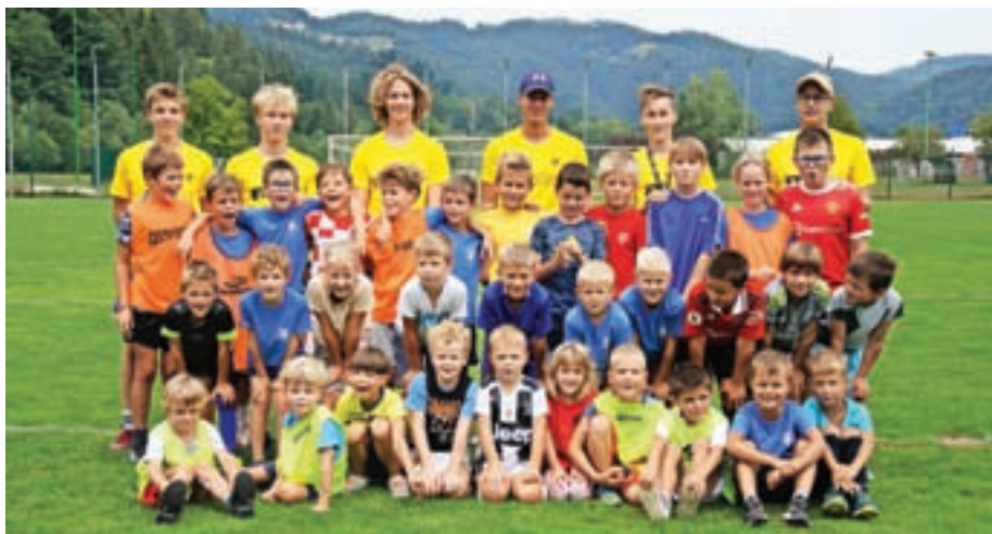
Udeleženci letošnje nogometne šole v Žireh

Nekaj več kot trideset dečkov in deklic iz Žirov in okolice je v zadnjem tednu avgusta uživalo v raznolikih dejavnostih, ki jih je pripravila pomlajena in zagnana ekipa trenerjev. V lovu na zaklad, ki je postal že stalnica nogometne šole, smo imeli letos prvič možnost vključiti