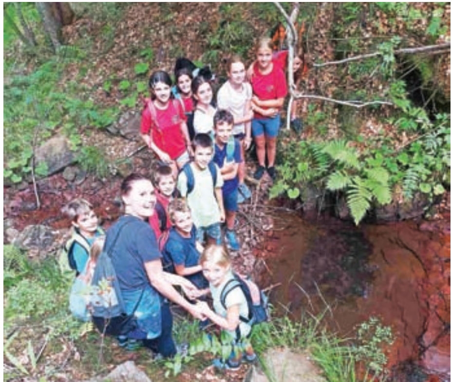
Utrinek s športnih priprav

Dela v Nordijskem centru Poclain nikoli ne zmanjka. Tako smo že skoraj zaključili gradnjo stopnic za lažji dostop do skakalnic. Hkrati ves čas skrbimo, da je naš nordijski center urejen in pripravljen za učinkovit trening. Glede na to, da smo v mesecu septembru, je to tudi čas začetkov športne-